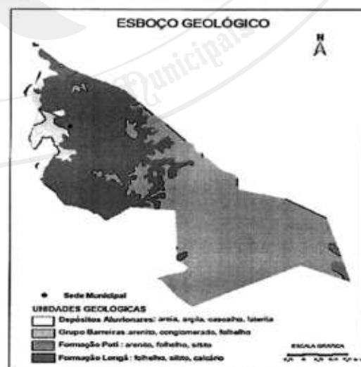
Esboço Geológico do município.

Do ponto de vista geológico, a figura abaixo mostra as unidades que se destacam no âmbito do município pertencem às coberturas sedimentares, conforme relacionadas abaixo. Encimando o pacote, e com idades mais recentes, destacam-se os sedimentos da unidade denominada Depósitos Aluvionares compreendendo areias e cascalhos inconsolidados. Seguem-se os sedimentos do Grupo Barreiras, o qual reúne arenito, conglomerado, intercalações de siltito e argilito. Logo após, aparecem os sedimentos da Formação Poti constituídos de arenito, folhelho e siltito. Na base do pacote repousa a Formação Longá agrupando arenito, siltito, folhelho e calcário.