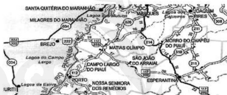
Mapa de situação do município.