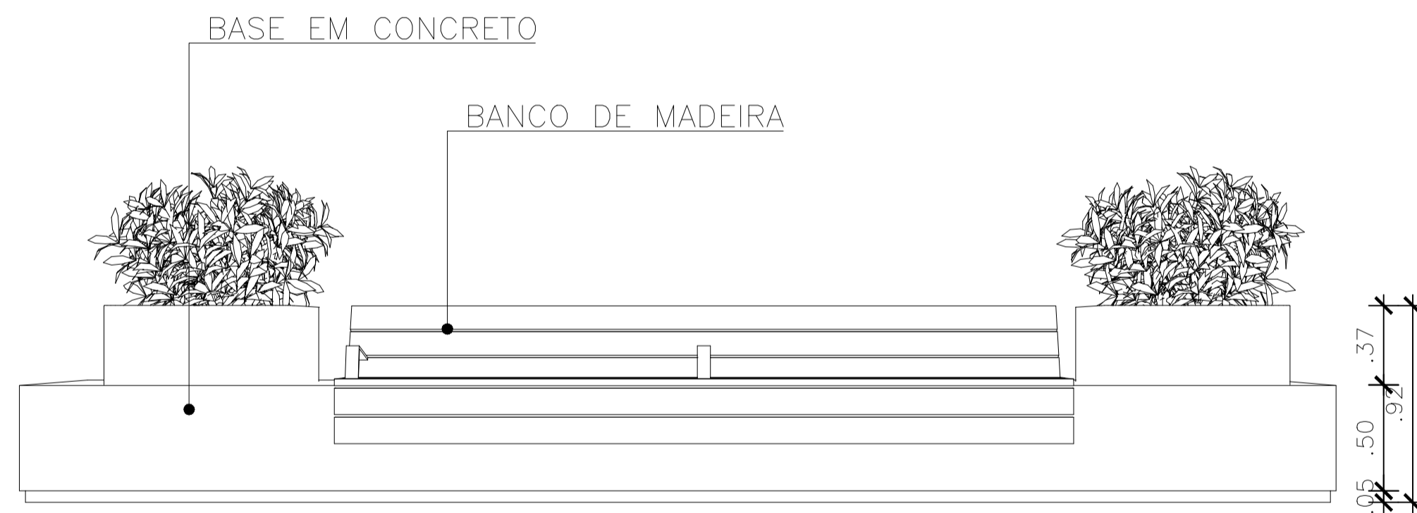
VISTA FRONTAL BANCO DE CONCRETO